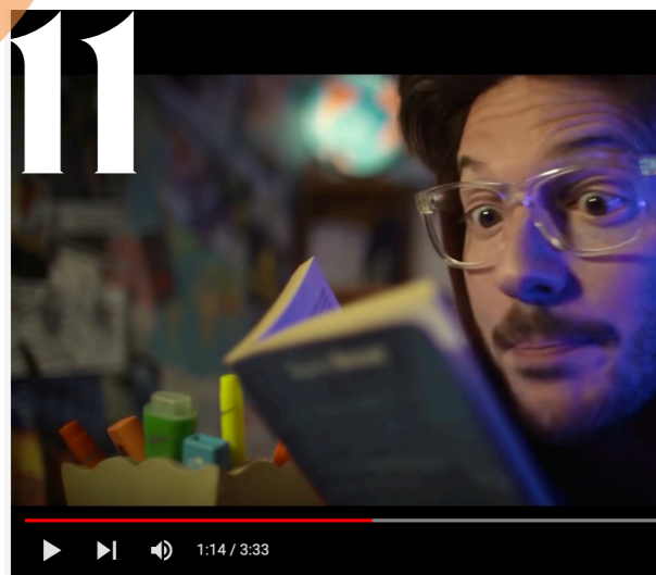
Et tout le monde s'en fout - La laïcité