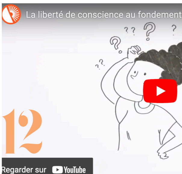
Regarder sur YouTube

https://irev.fr/thematiques/discriminations-egalite-laicite/laicite/les-tutos-laicite-et-tout-le-monde-sen-fout