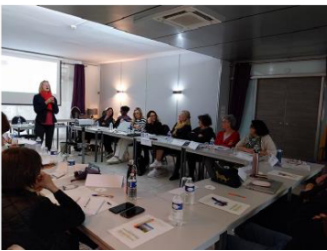
Photo d'une formation avec les CTSS, 2024, Région académique de Nouvelle-Aquitaine

Renforcer la posture managériale des conseillers techniques de service social comme levier de prévention des risques psychosociaux et de développement des compétences en matière d'accompagnement social des élèves de la région académique de Nouvelle-Aquitaine.