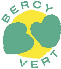
Logo bercy vert

Dans le cadre du plan « Bercy Vert » mis en place en 2020, le ministère de l'Économie, des Finances et de la Relance agit pour être exemplaire en matière