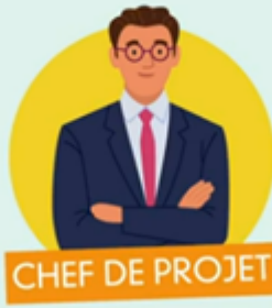
CHEF DE PROJET