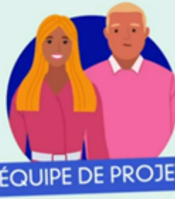
ÉQUIPE DE PROJET

Un projet public nécessite la création d'une équipe