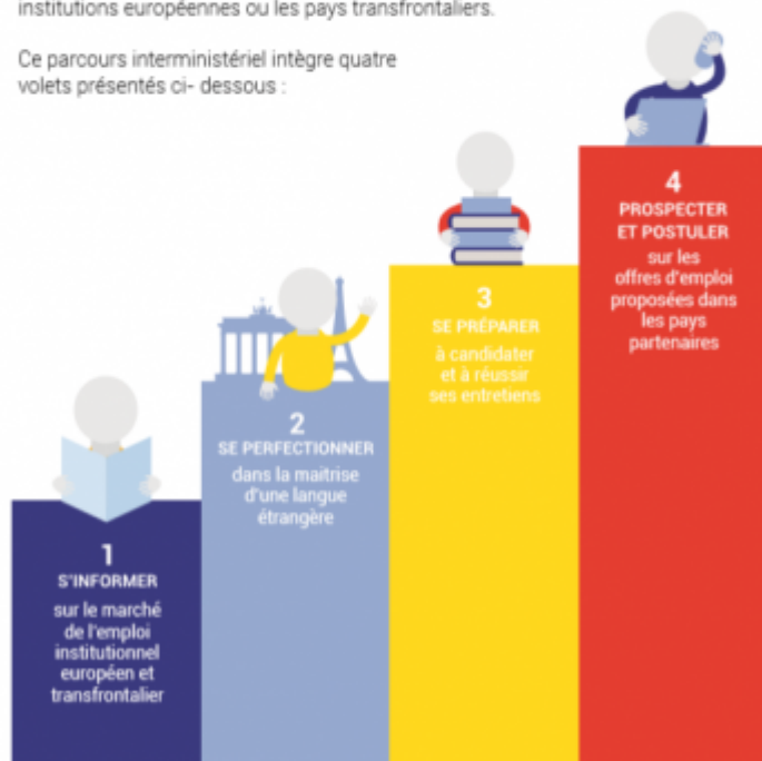
Les différentes étapes de la démarche

Ce parcours interministériel intègre quatre volets présentés ci- dessous :